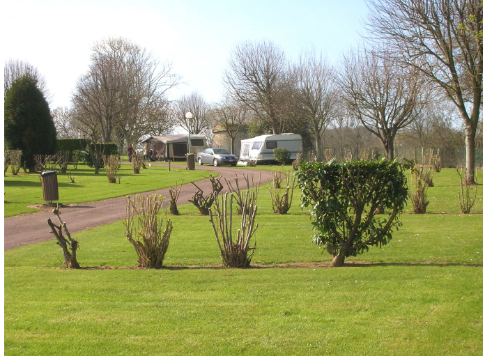
Camping des Trois Rivières et ses emplacements type "pelouse de golf"