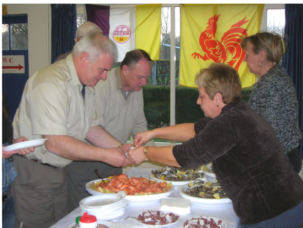
Dégustation des produits normands

J'allais oublier la balade des poissons!