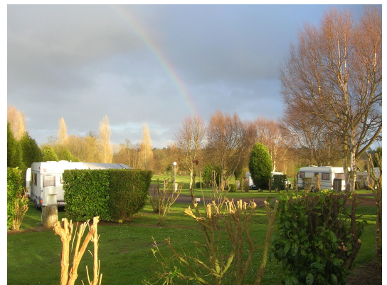
Arc en ciel sur le camping

Il y a aussi un soleil en Normandie! Il nous tiendra compagnie toute la journée. Nous en profiterons pour monter notre auvent. Allez savoir pourquoi certains vieux matériels, résisteront mieux au vent que d'autres plus récents! Mal ficelés peut-être? Les mains ne sont pas toujours aussi efficaces que les pieds!