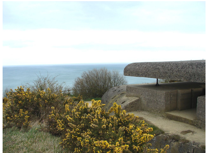
Batteries de Longues, le poste d'observation avec vue sur mer