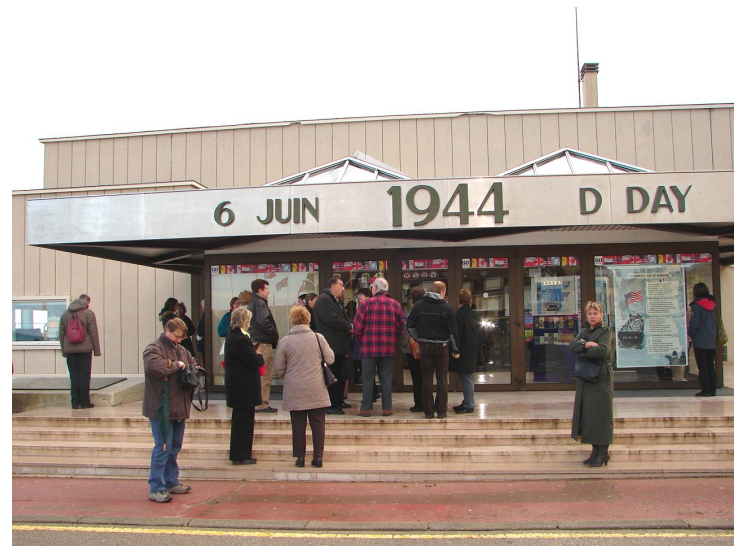
Le musée du Port du débarquement de juin 44 d'Arromanches