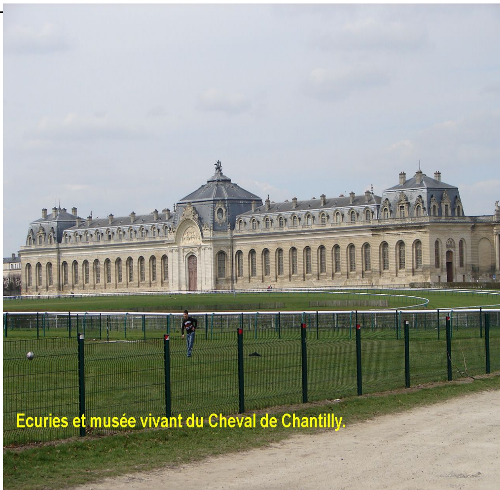
Ecuries et musée vivant du Cheval de Chantilly.