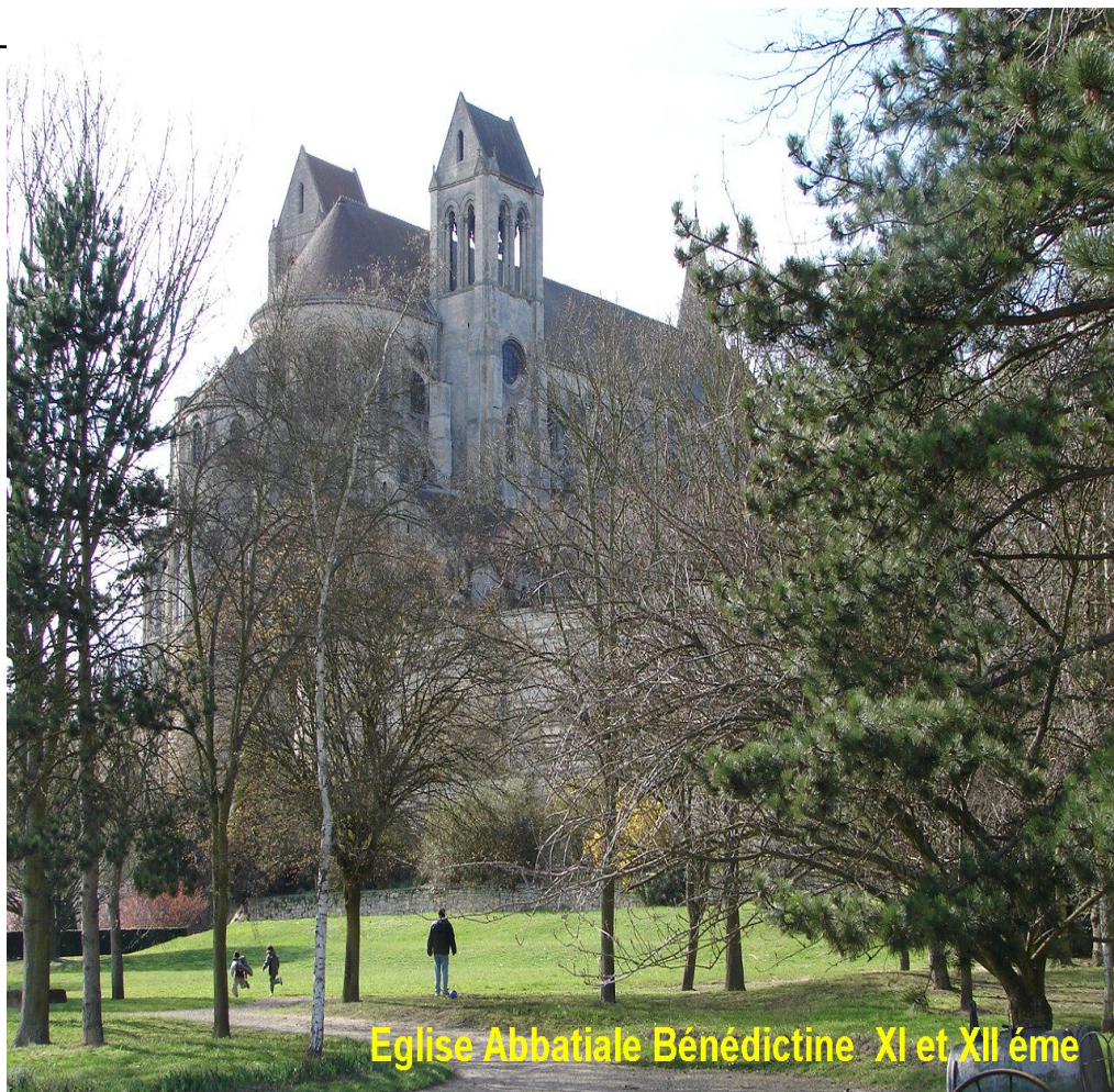
Eglise Abbatiale Bénédictine XI et XII éme