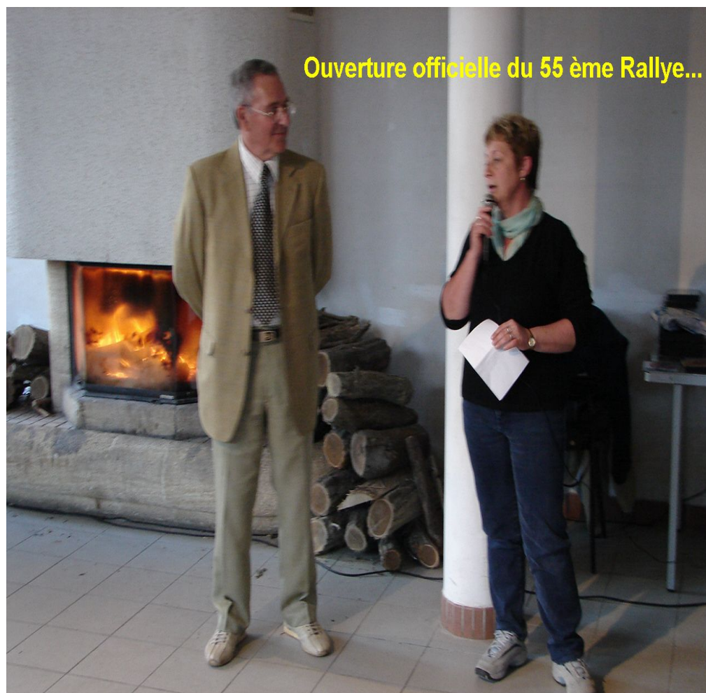
Ouverture officielle du 55 éme Rallye...