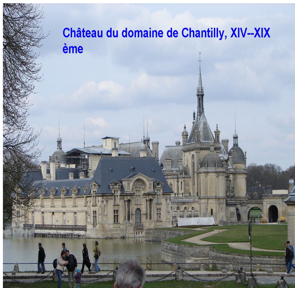
Château du domaine de Chantilly, XIV--XIX ème