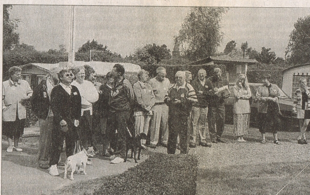
Après le verre de l'amitié, les participants ont accompli un périple à travers la Thiérache...